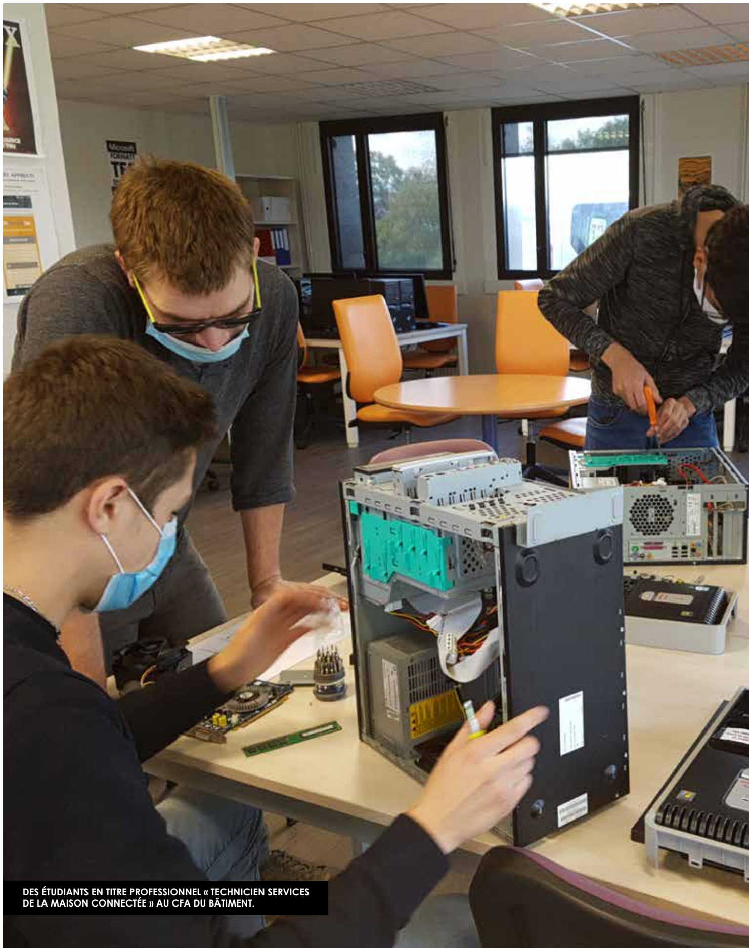
DES ÉTUDIANTS EN TITRE PROFESSIONNEL « TECHNICIEN SERVICES DE LA MAISON CONNECTÉE » AU CFA DU BÂTIMENT.