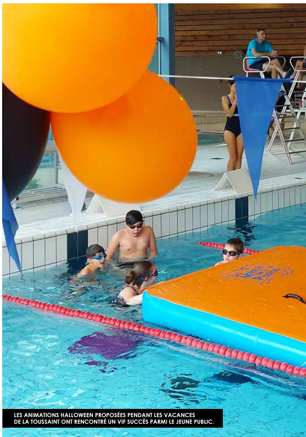
LES ANIMATIONS HALLOWEEN PROPOSÉES PENDANT LES VACANCES DE LA TOUSSAINT ONT RENCONTRÉ UN VIF SUCCÈS PARMIS LE JEUNE PUBLIC.

Dans le cadre de son projet d'établissement, Tulle agglo va lancer une grande concertation sur le centre aqua. Chacun pourra exprimer son avis et ses envies. Un questionnaire en ligne sera accessible fin 2020 - début 2021. Parmi les participants, quelques chanceux pourront gagner des lots et notamment un an d'entrées gratuites ! Infos à venir sur : www.agglo-tulle.fr