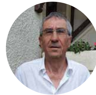
Saint-Salvador Pierre-Marie CAPY (maire)