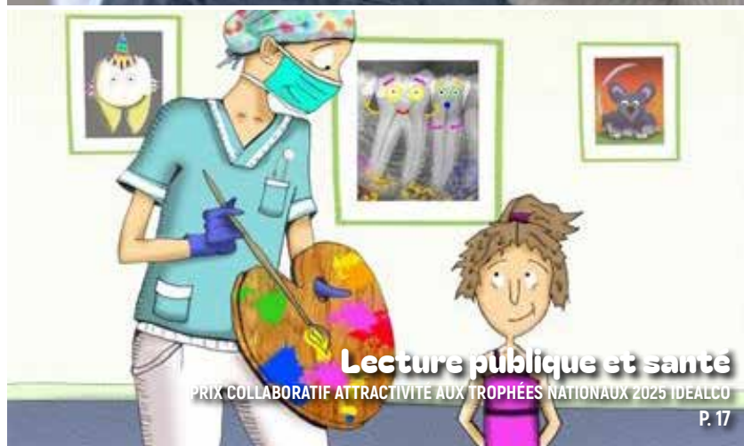
Lecture publique et santé PRIX COLLABORATIF ATTRACTIVITÉ AUX TROPHÉES NATIONAUX 2025 IDEALCO P. 17