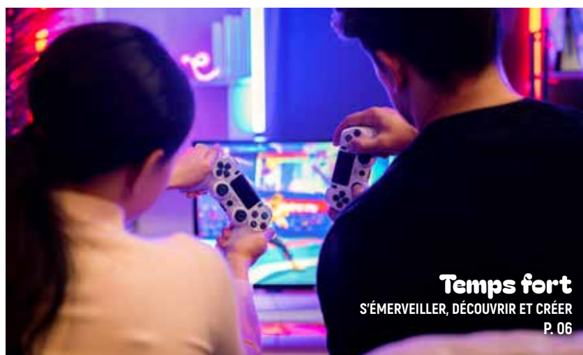
Temps fort S'ÉMERVEILLER, DÉCOUVRIR ET CRÉER P. 06