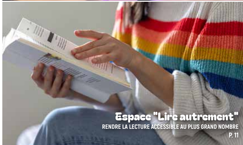
Espace "Lire autrement" RENDRE LA LECTURE ACCESSIBLE AU PLUS GRAND NOMBRE P. 11