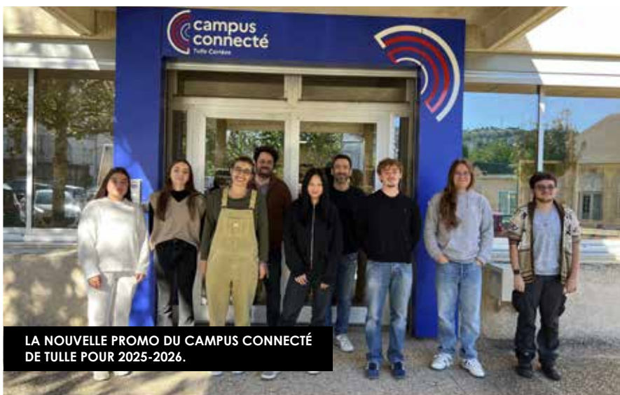
LA NOUVELLE PROMO DU CAMPUS CONNECTÉ DE TULLE POUR 2025-2026.