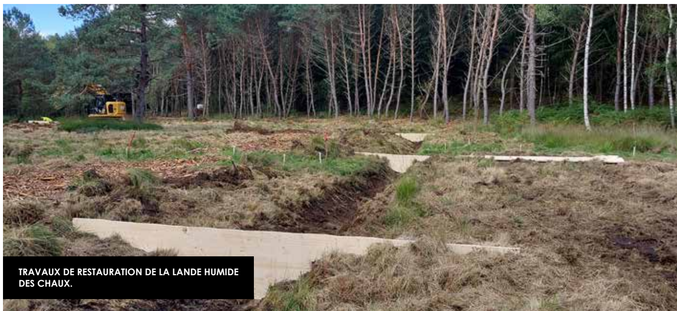
TRAVAUX DE RESTAURATION DE LA LANDE HUMIDE DES CHAUX.