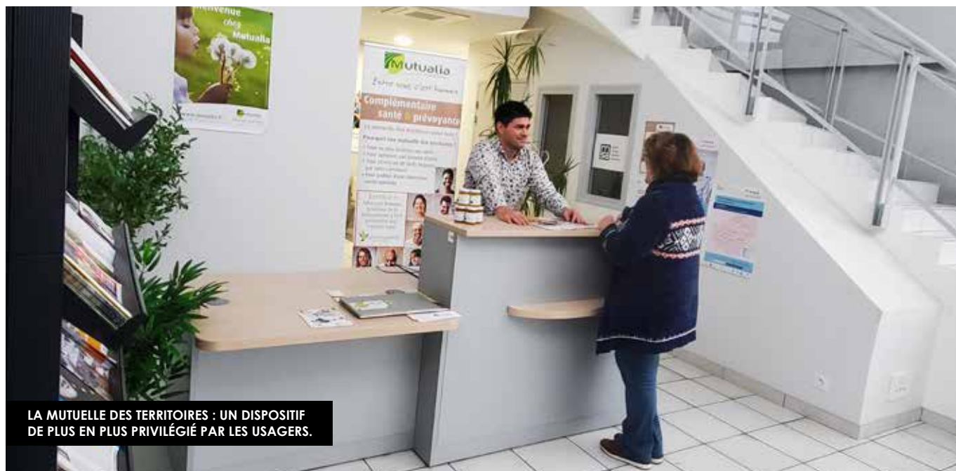
LA MUTUELLE DES TERRITOIRES : UN DISPOSITIF DE PLUS EN PLUS PRIVILÉGIÉ PAR LES USAGERS.