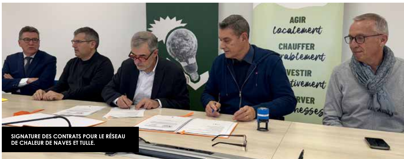
SIGNATURE DES CONTRATS POUR LE RÉSEAU DE CHALEUR DE NAVES ET TULLE.