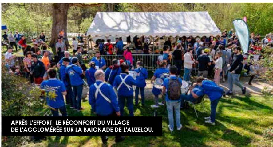
APRÈS L'EFFORT, LE RÉCONFORT DU VILLAGE DE L'AGGLOMÉRÉE SUR LA BAIGNADE DE L'AUZÉLOU.