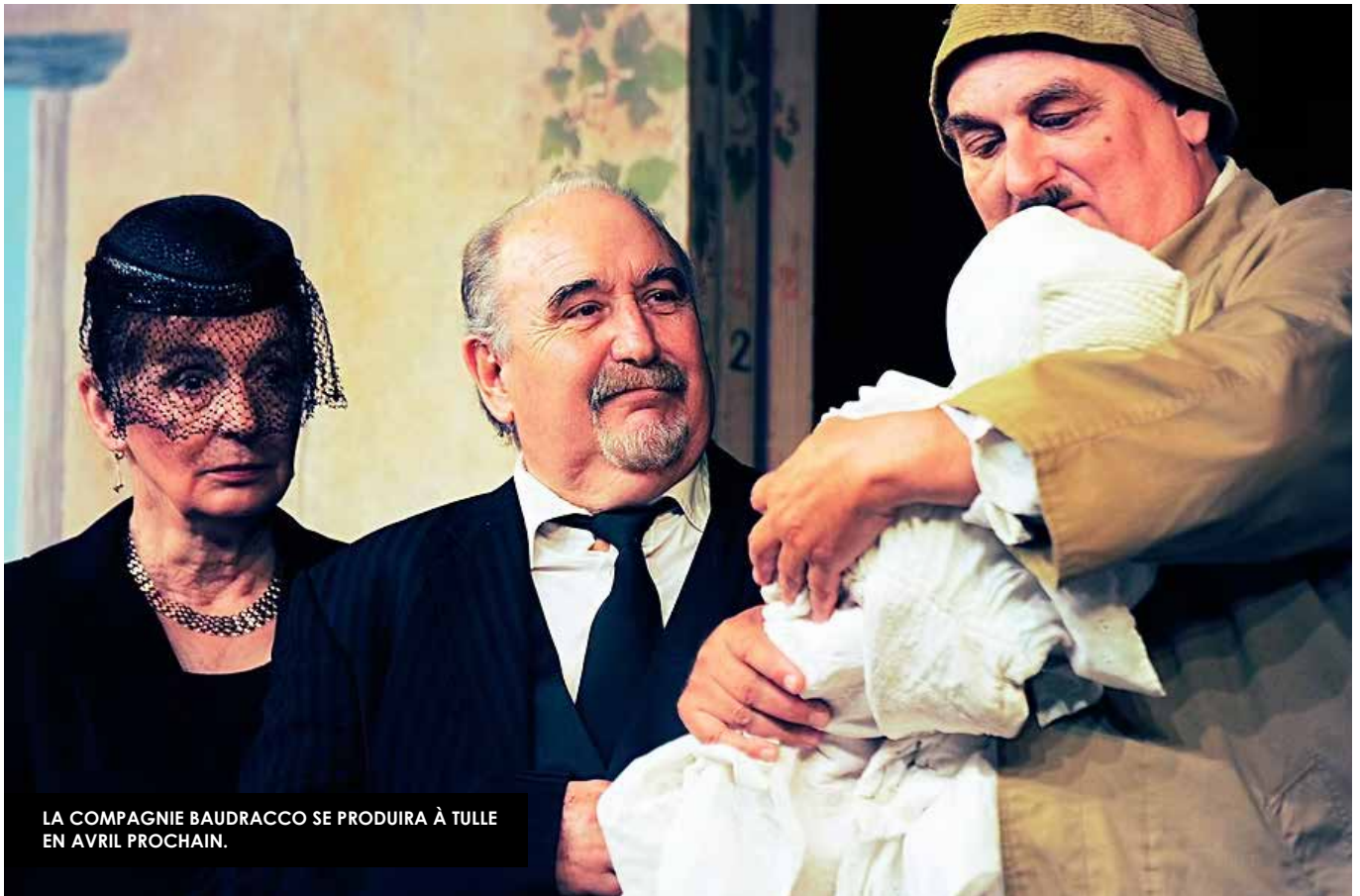
LA COMPAGNIE BAUDRACCO SE PRODUIRA À TULLE EN AVRIL PROCHAIN.