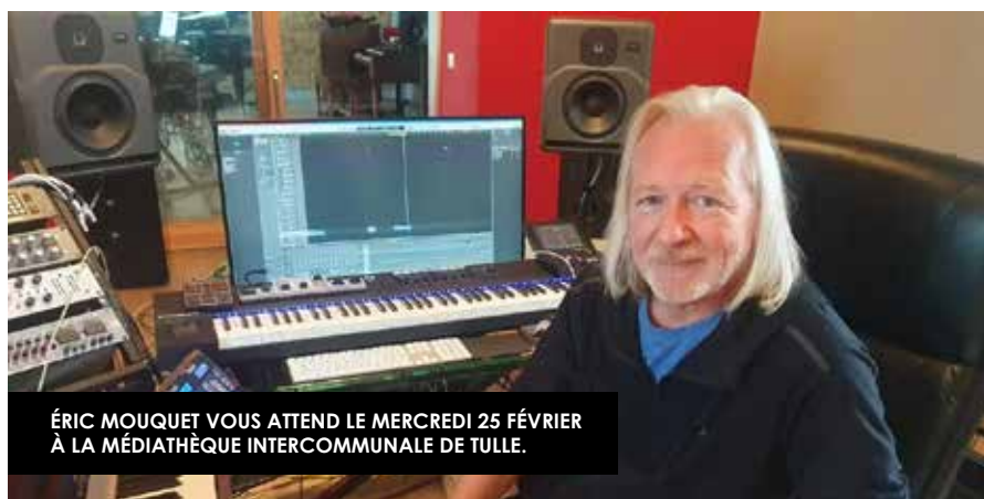
ÉRIC MOUQUET VOUS ATTEND LE MERCREDI 25 FÉVRIER À LA MÉDIATHÈQUE INTERCOMMUNALE DE TULLE.