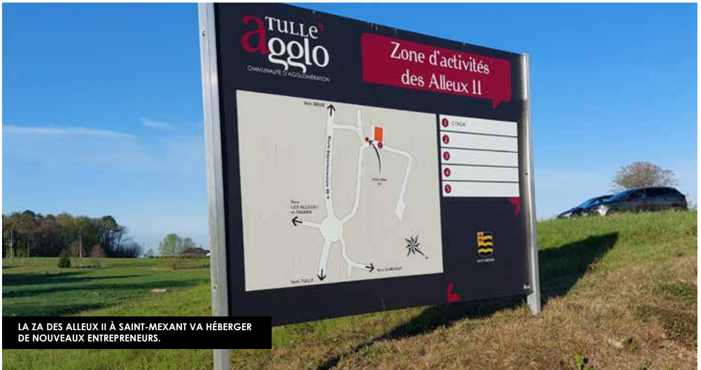
LA ZA DES ALLEUX II À SAINT-MEXANT VA HÉBERGER DE NOUVEAUX ENTREPRENEURS.