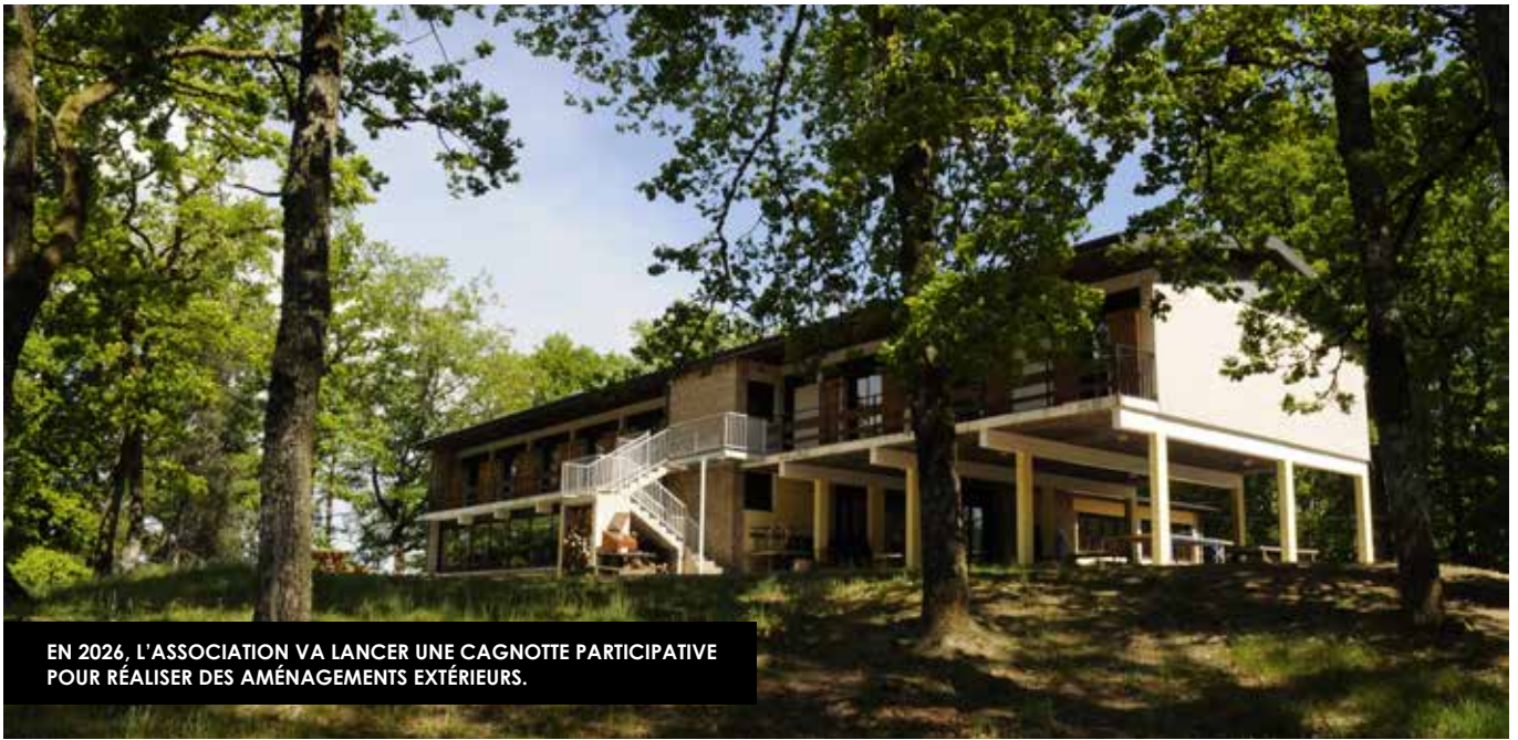
EN 2026, L'ASSOCIATION VA LANCER UNE CAGNOTTE PARTICIPATIVE POUR RÉALISER DES AMÉNAGEMENTS EXTÉRIEURS.