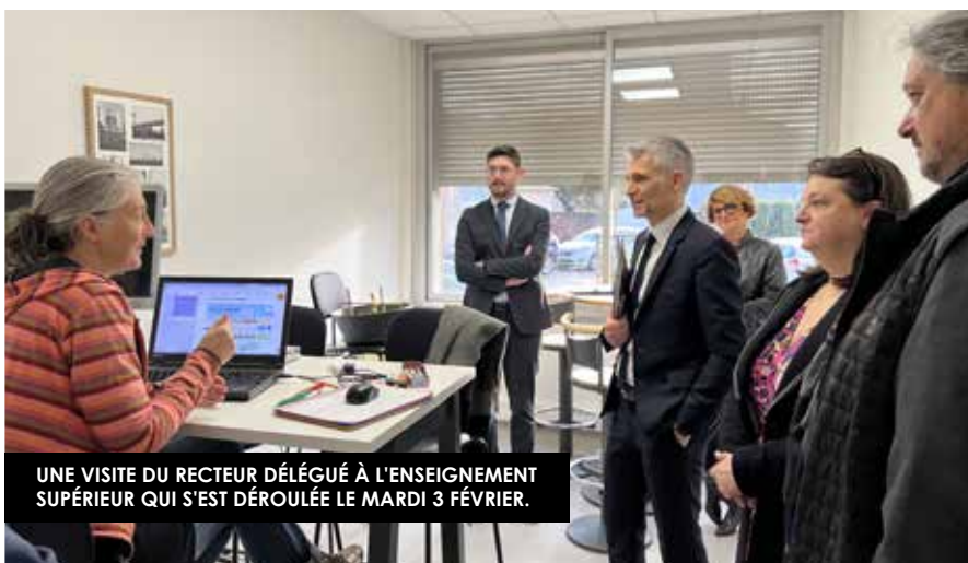
UNE VISITE DU RECTEUR DÉLÉGUÉ À L'ENSEIGNEMENT SUPÉRIEUR QUI S'EST DÉROULÉE LE MARDI 3 FÉVRIER.