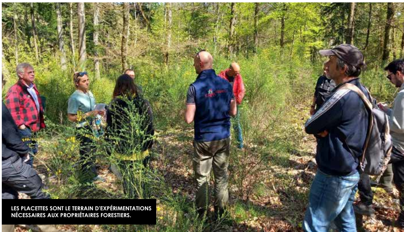
LES PLACETTES SONT LE TERRAIN D'EXPÉRIMENTATIONS NÉCESSAIRES AUX PROPRIÉTAIRES FORESTIERS.