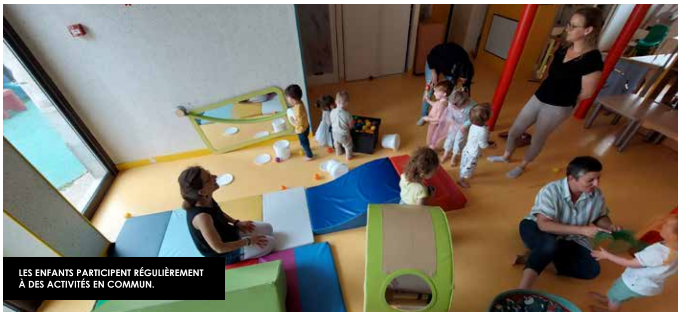
LES ENFANTS PARTICIPENT RÉGULIÈREMENT À DES ACTIVITÉS EN COMMUN.